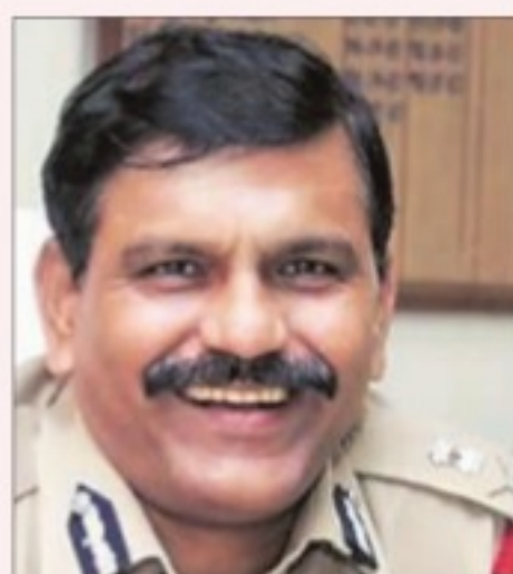
M Nageswara Rao holds interim charge of CBI

"It appears that this particular (selection) committee has been completely bypassed by the Union of India which has arbitrarily and without any jurisdiction appointed Nageswara Rao as Interim Director, CBI on January 10,